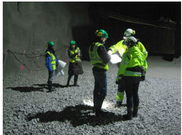
図 3 地層処分場の運用前段階での DIV 活動