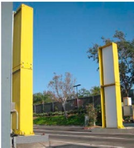
図 2 施設出入口に設置された放射線モニター